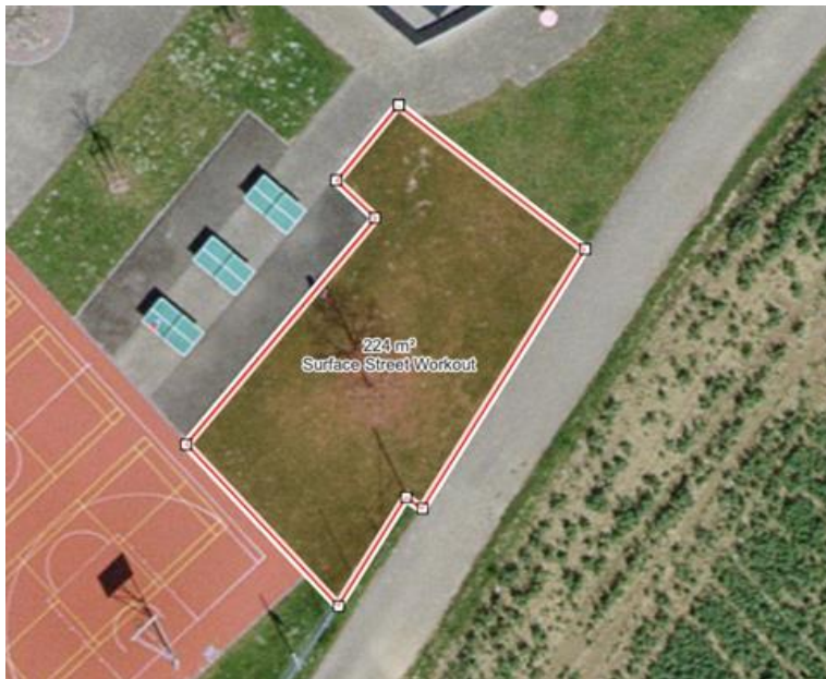
Fig. 1. Emplacement envisagé

En février 2023, votre Autorité avait accepté le classement de la motion déposée par le PLR Milvignes visant à la création d'un street workout sur le territoire communal. Le rapport annonçait que le CPNE-BC (Centre de formation professionnelle neuchâtelois, pôle Bâtiment et construction), pour son cinquantième anniversaire, allait justement en construire un sur son terrain (BF 4884 du cadastre de Colombier).